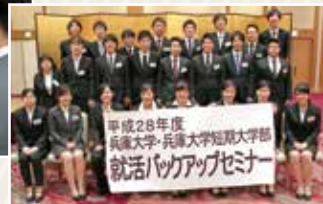
就活バックアップセミナー