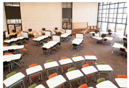
としょかん 図書館／ラーニングcommons