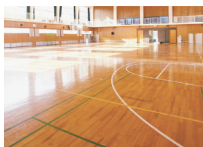
たいいくかん 体育館