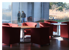
きゅうけい 休憩スペース