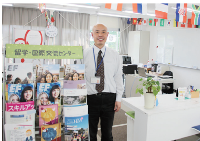
りゅうがく こくさいこうりゅう 留学・国際交流センター

うつく しぜん なか じゅうつか 美しい自然の中に自由に使えるPCルームやプレゼンテーションやグループ学習に使用できる がくしゅう しよう ラーニングcommonsなど充実した学習施設を取り揃えています。 がくせいしょくどう きゅうけい また、学生食堂や休憩スペースもありますので、友達との交流を楽しんでください。