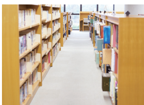
としょかん 図書館