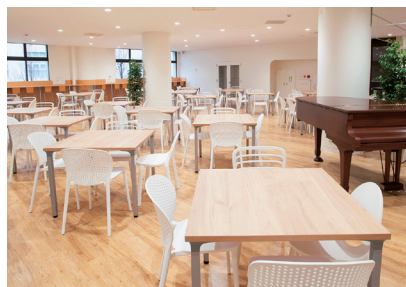
がくせいしょくどう 学生食堂